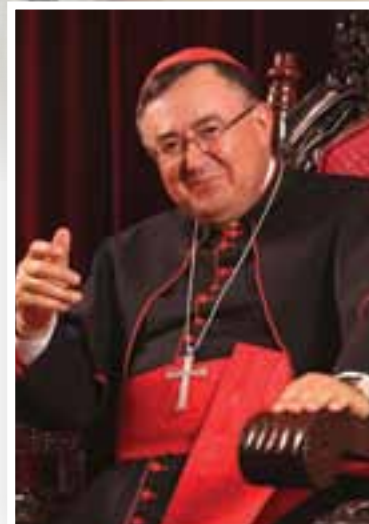
Nadbiskup Vinko kard. Puljić

Zato molimo da svako mlado biće osvoji nutarnju slobodu, da hrabro zakorači u školu križa, da povjeruje Gospodinu, da otvori srce, kako bi ga čulo i poslušalo. I kada ljudi dožive mlado biće zahvaćeno Kristom, dožive izazov pred kojim stanu i dive se.