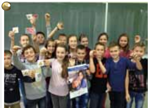
Ove je godine KŠC "Petar Barbarić" Travnik podržao IX. misijsku akciju