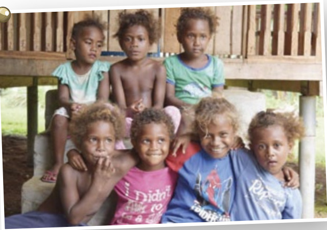
Fotografija: Salomonski Otcoci